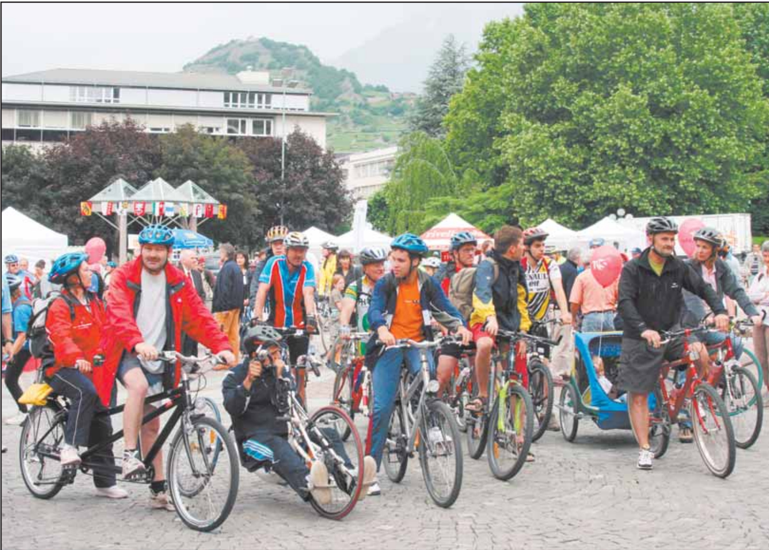
L'an dernier, la 1 re slowUp Valais avait attiré 15 000 personnes malgré un temps maussade. Dimanche, 20 000 participants sont attendus.

vingt mille personnes sont attendues sur le parcours ou une partie du parcours.